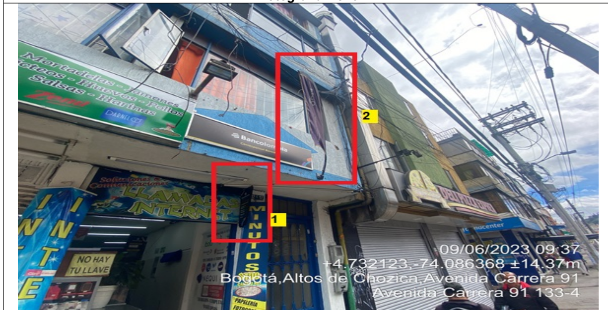
Fotografía No. 3

En la cual se evidencian dos (2) elementos publicitarios identificados con los números 1 y 2, pertenecientes al establecimiento comercial SOLUCIONES Y COMUNICACIONES VILLA ELISA, los cuales se encuentran volados de la fachada del establecimiento y son adicionales al único permitido por fachada de establecimiento comercial.