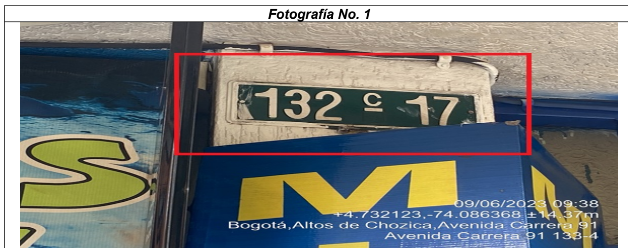
Fotografía No. 1

En la cual se evidencia la nomenclatura urbana donde se ubica el establecimiento comercial "SOLUCIONES Y COMUNICACIONES VILLA ELISA" en la CR 91 No. 132 C – 17 localidad de Suba.