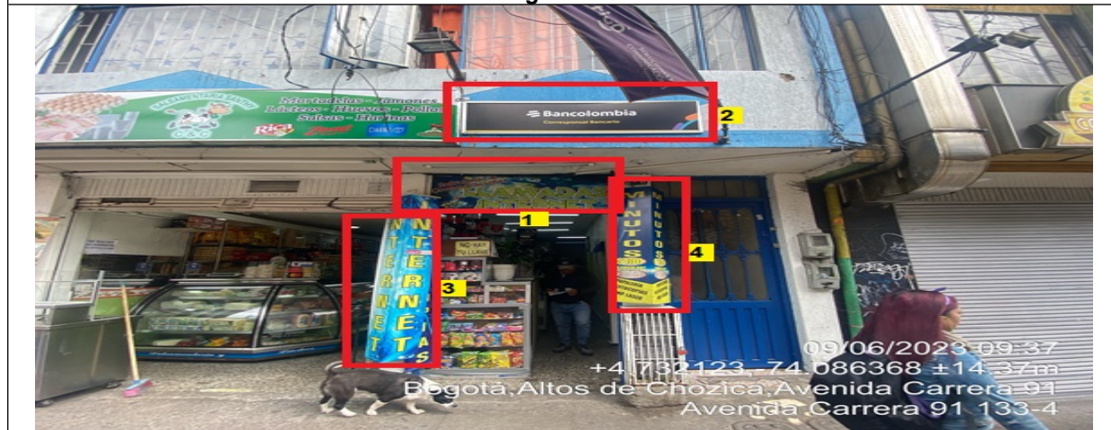
Fotografía No. 2

En la cual se evidencia la fachada del establecimiento comercial SOLUCIONES Y COMUNICACIONES VILLA ELISA, en la que se observa: un (1) elemento publicitario identificado con el número 1, el cual al